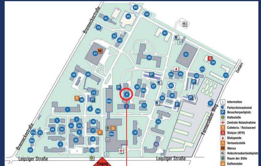
Universitätsklinik für HNO-Heilkunde, Haus 8